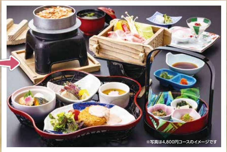
※写真は4,800円コースのイメージです