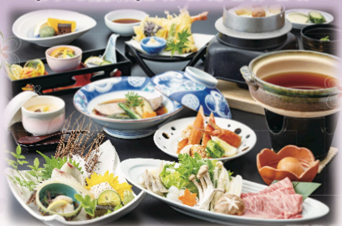
法要会席 藤の一例